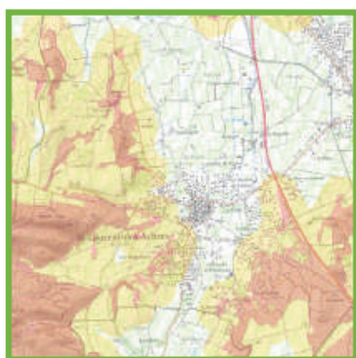
Carte délimitant les espaces soumis à la réglementation du débroussaillage, éditée par la préfecture

L'identification des administrés concernés s'effectue donc à partir de :