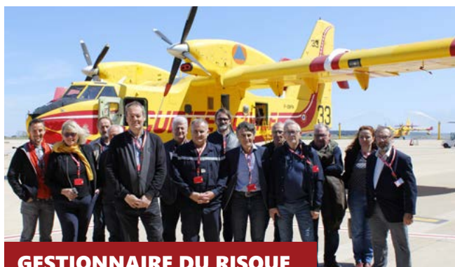
GESTIONNAIRE DU RISQUE