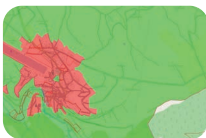
Document d'urbanisme en vigueur dans la commune : PLU/ PLUi, carte communale,...