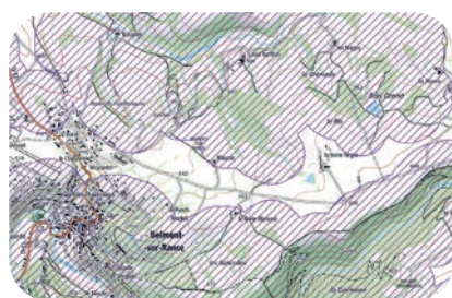
Carte délimitant les espaces soumis à la réglementation du débroussaillage, éditée par la Préfecture.