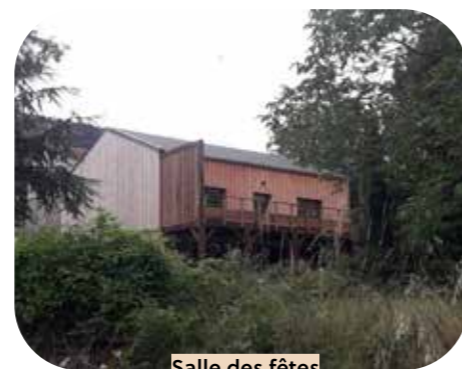
Salle des fêtes Quirbajou