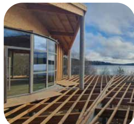
Chantier de la base nautique de Laprade Basse Cuxac-Cabardès

Le bois provient de la forêt de Puivert. La livraison est prévue en juin 2027. Une belle réussite et une méthode à renouveler !