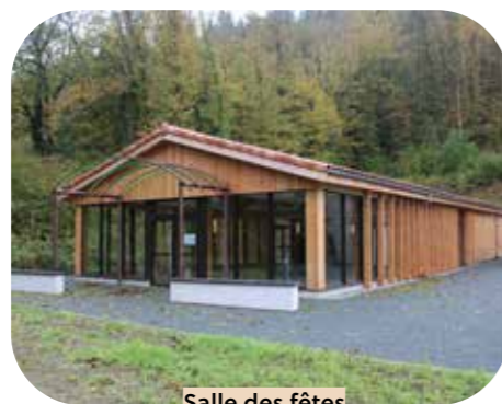
Salle des fêtes Cuxac-Cabardès