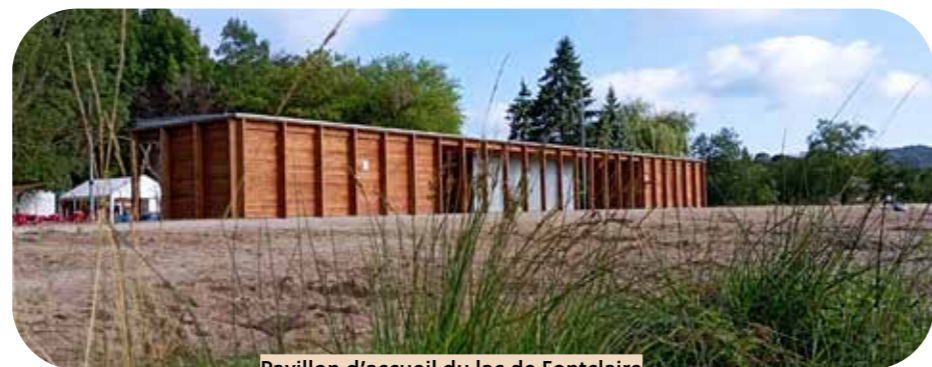
Pavillon d'accueil du lac de Fontclaire Puivert