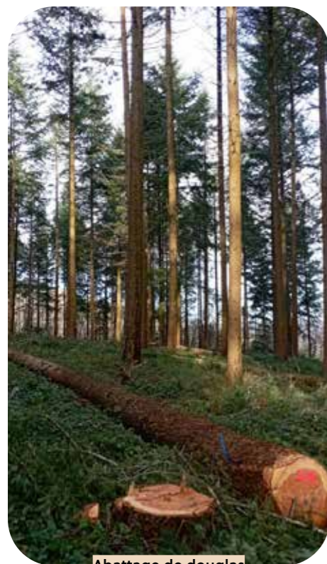
Abattage de douglas Puivert