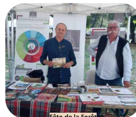
Fête de la Forêt Le Vigan