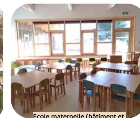
Ecole maternelle (bâtiment et mobilier bois) Rousson