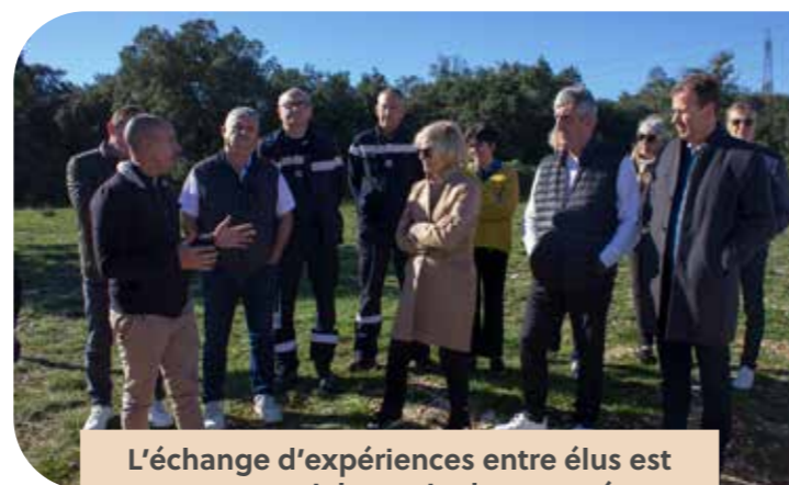
L'échange d'expériences entre élus est un axe essentiel au sein de notre réseau

Chaque année, ces structures publiques investissent des moyens conséquents pour créer et entretenir des pistes et des points d'eau qui serviront aux pompiers pour la lutte. A notre invitation, la Présidente du Conseil Départemental de l'Aude est venue avec ses services échanger avec les partenaires de la DFCI dans le Gard, pour tirer bénéfice de cette expérience dans la reconstitution du territoire audois incendié.