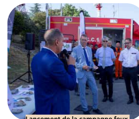
Lancement de la campagne feux de forêt - Mont Aigoual