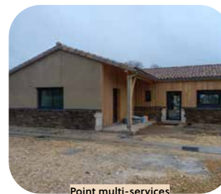
Point multi-services Sénéchas