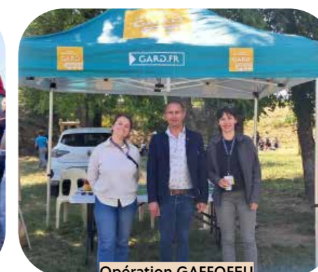
Opération GAFFOFEU Bagnols-sur-Cèze