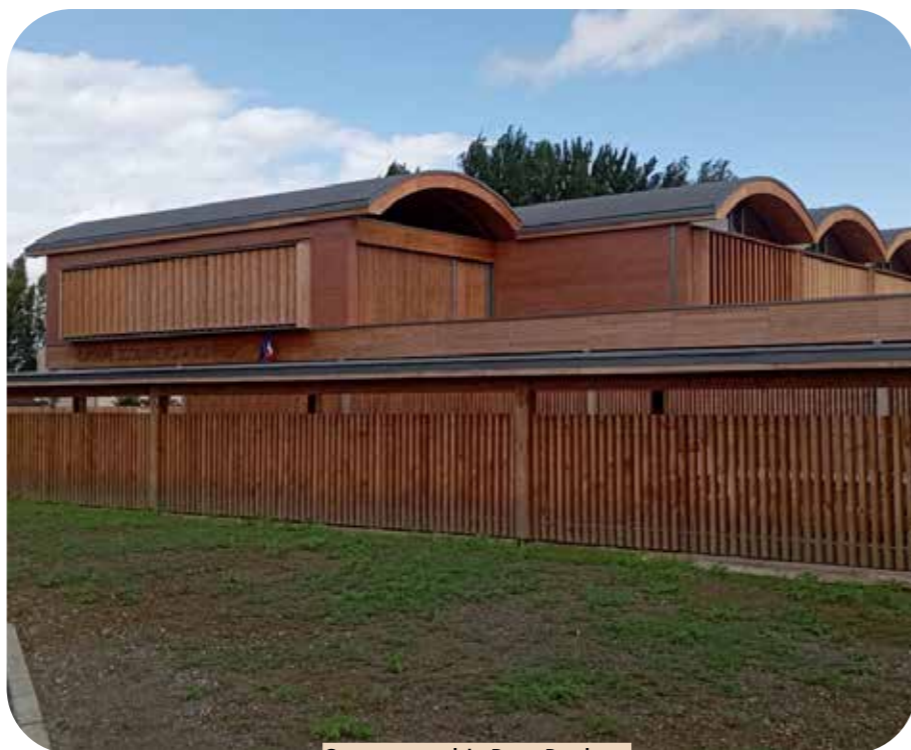
Groupe scolaire Rosa Bonheur Aucamville