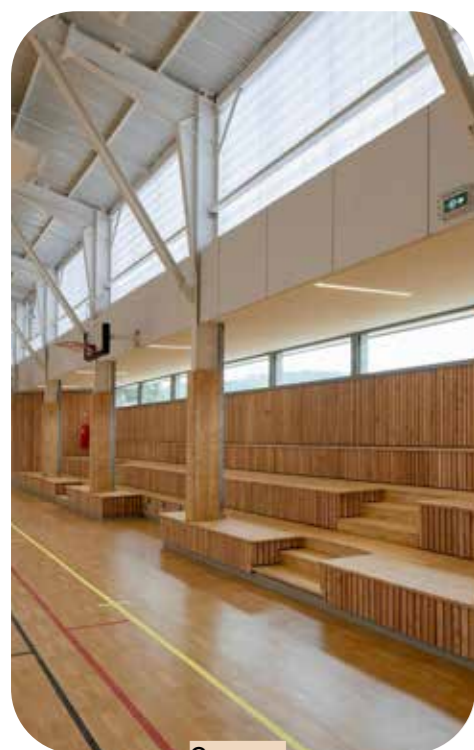
Gymnase Salies du Salat