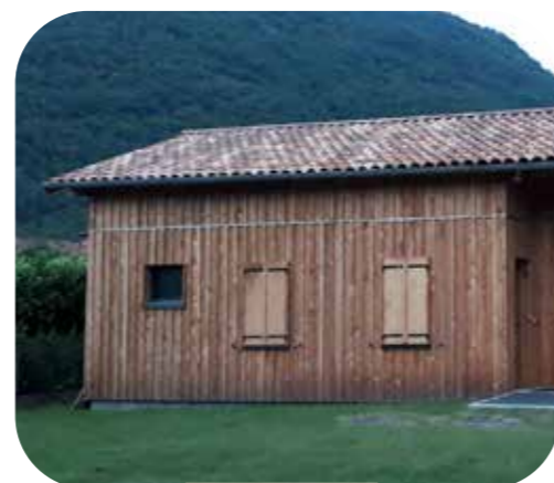
Atelier municipal Malvezie

Fin 2025 un nouveau projet démarre sur ces bases : le centre culturel de Bordeblanche.