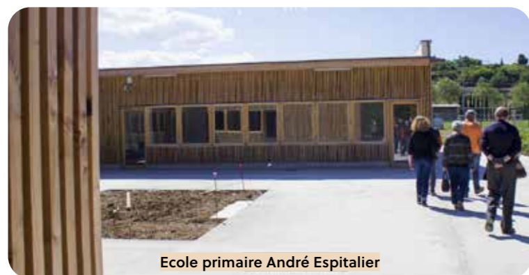
Ecole primaire André Espitalier Fontès