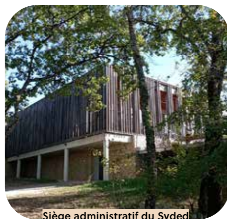
Siège administratif du Syded Catus