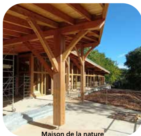
Maison de la nature Dégagnac