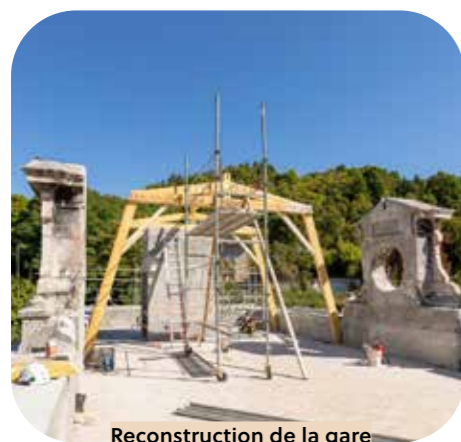
Reconstruction de la gare Figeac