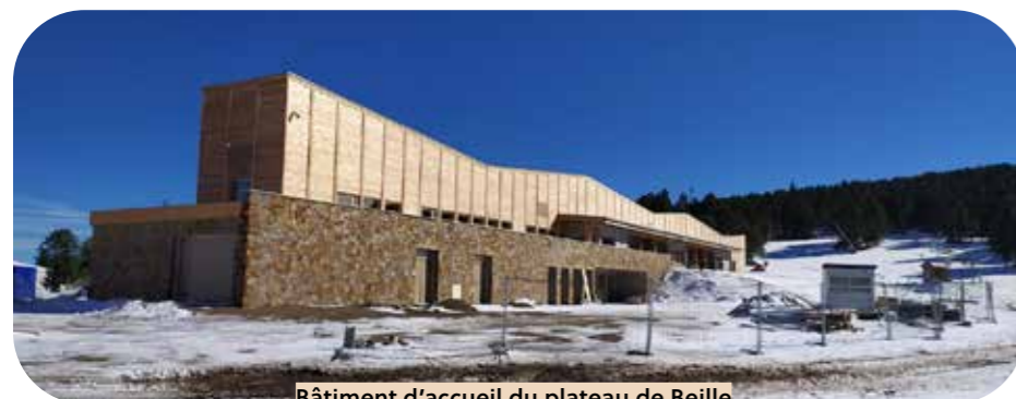
Bâtiment d'accueil du plateau de Beille Les Cabannes