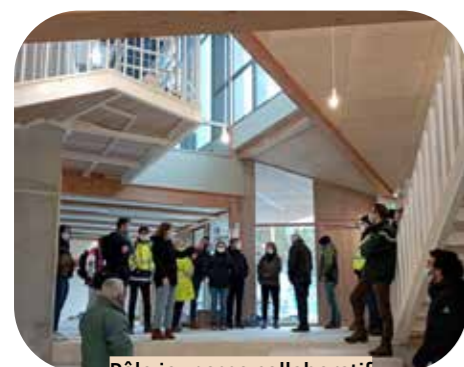
Pôle jeunesse collaboratif Foix