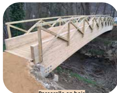
Passerelle en bois St Paul de Jarrat