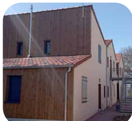
Ensemble de logements sociaux - ALOGEA Luzenac

Le bois et les entreprises retenues seront pyrénéennes !