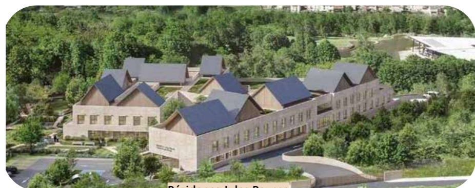
Résidence Jules Rouse Tarascon sur Ariège